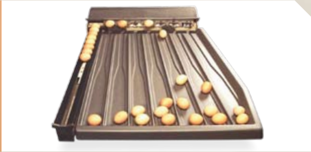
Moba 68 / Moba 88